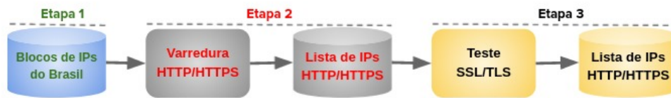
Figura 1. Processo de coleta e análise dos dados

tacar que diversos provedores de Internet acabaram por bloquear nossas varreduras, pois interpretaram as requisições aos IPs dos respectivos blocos como varreduras pré-ataque. Sem os bloqueios certamente aumentaríamos o número de IPs identificados com HTTPS habilitado. Um dos nossos objetivos futuros é executar novas varreduras utilizando estratégias e ferramentas para evitar os bloqueios.